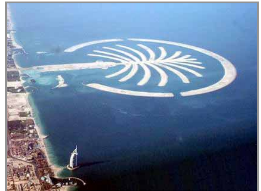
Palm Island Dubai (UAE)