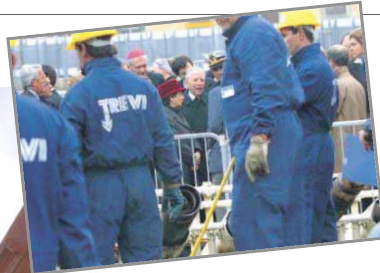
Intervento di consolidamento Torre di Pisa Pisa (Italia)