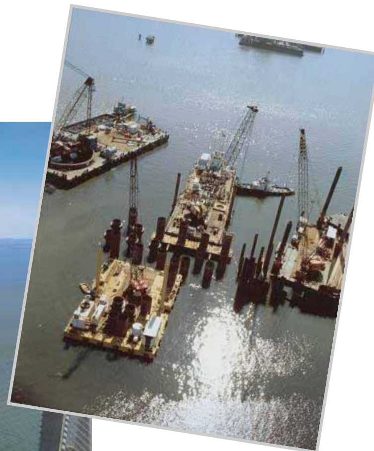
Ponte "Vasco Da Gama" Lisbona (Portogallo)